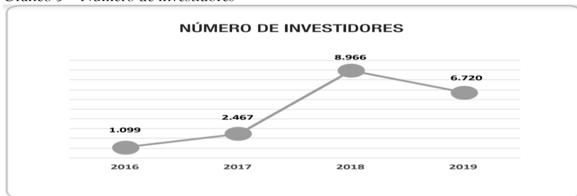
Gráfico 5 - Número de investidores

Em relação aos investidores, foram identificadas 1.099 pessoas que efetivamente aportaram seus recursos via Crowdfunding de investimento em 2016, e em 2019, 6.720. Embora tenha havido curva mais acentuada a partir de 2018, diferente do observado em relação aos demais dados, o número de investidores decresceu 25% entre 2018 e 2019.