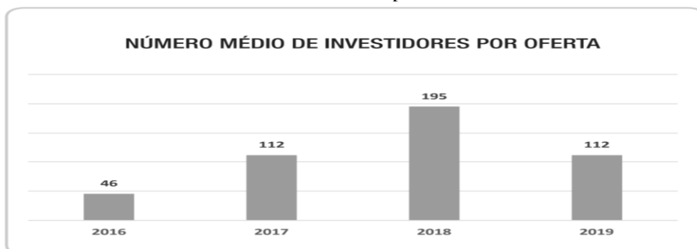
Gráfico 6 - Número médio de investidores por oferta

A referida redução também é vista no quesito “investidores por oferta pública”. A quantidade de investidores por oferta aumentou progressivamente em 2017 e em 2018, mas decresceu em 2019 a uma taxa similar ao seu último ciclo de crescimento. Ao final, tem-se que o número de investidores por oferta pública em 2019 é idêntico ao de 2017. Assim como na subseção anterior, não foi possível atribuir este comportamento a uma razão específica.