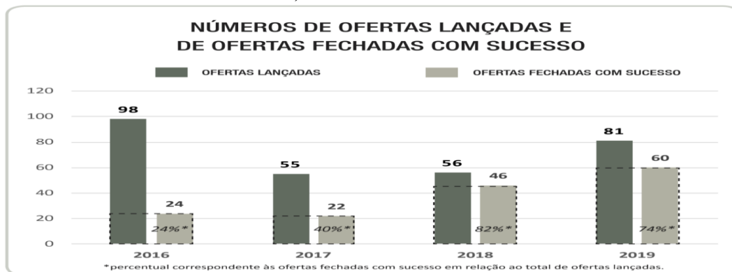
Gráfico 2 - Número de ofertas lançadas e de ofertas fechadas com sucesso

No entanto, como se viu no trabalho de Felipe e Ferreira (2020), pode ser que a justificativa reside em outros fatores, como na experiência alcançada pelos envolvidos com o setor e na adoção de específicas estratégias e de metas de financiamento mais elevadas, disponibilizadas por maior tempo, com previsão tanto de atuação de investidor qualificado quanto de participação preestabelecida.