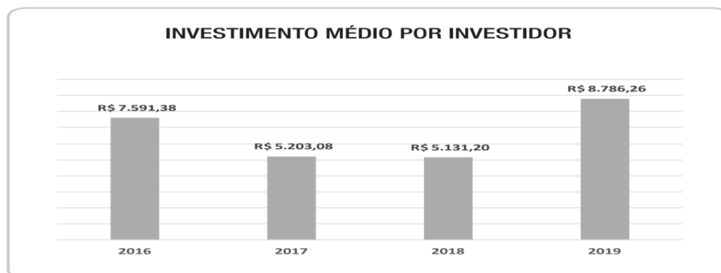
Gráfico 7 - Investimento médio por investidor

No que se refere ao valor médio do aporte realizado por cada investidor, em 2016, era de R$ 7.591,38. Entre 2017 e 2018, tal valor reduziu e voltou a subir em 2019 para o patamar de R$ 8.786,26. Nota-se que não houve incremento relevante no aporte realizado pelos investidores a partir da regulação do Crowdfunding de Investimento.