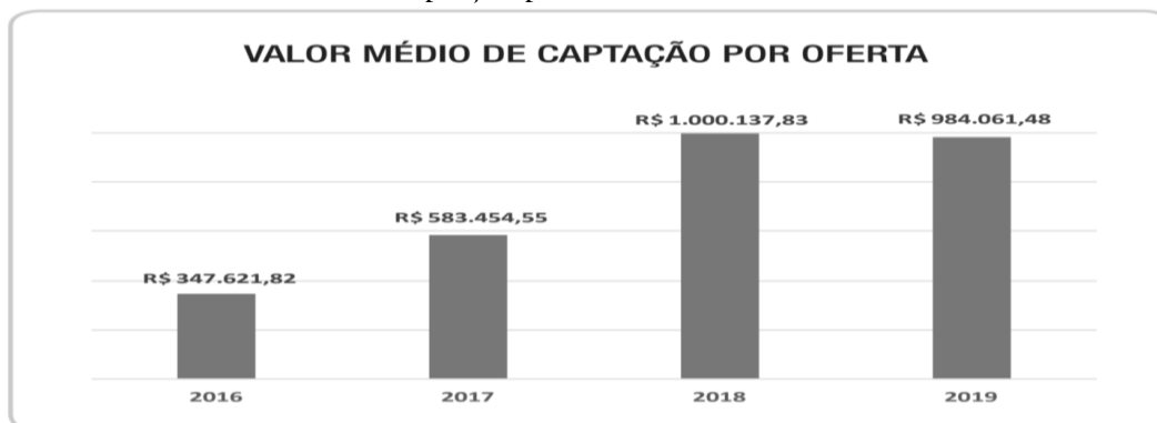
Gráfico 4 - Valor médio de captação por oferta

O mesmo contexto foi observado quanto ao valor médio por cada captação. Em 2016, o valor médio era de R$ 347.621,82 e, em 2019, o valor médio foi de R$ 984.061,48, número próximo da média alcançada no ano anterior e notadamente superior à média encontrada nos anos “pré-regulação” específica.