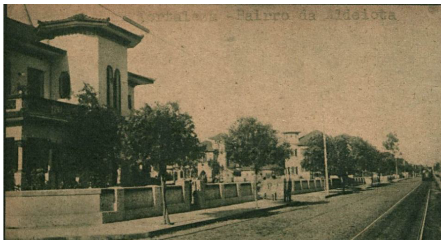
► Figura 1: Fortaleza, vista do bairro da Aldeota.