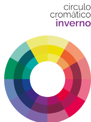
► Figura 3: Círculo cromático inverno