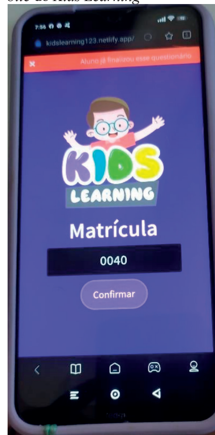
Figura 1- Tela inicial na versão mobile do Kids Learning

web do Kids Learning . A Figura 3 exibe a tela inicial da aplicação com destaque para as visualizações.