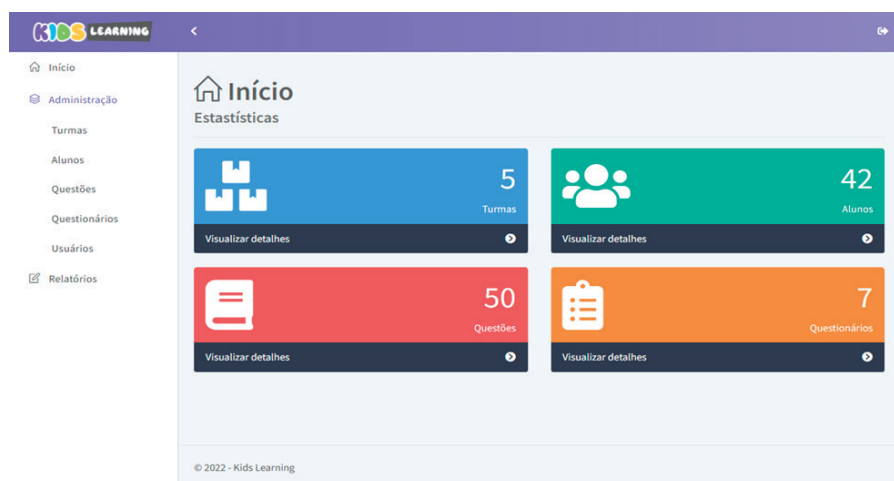
Figura 3 - Tela das visualizações