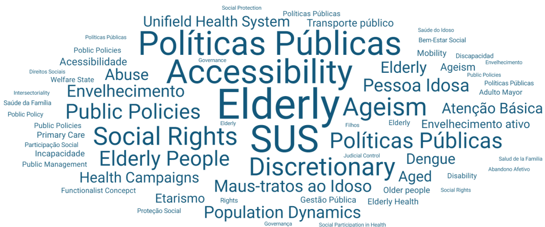
Figura 2 – Nuvem de palavras-chave dos artigos selecionados